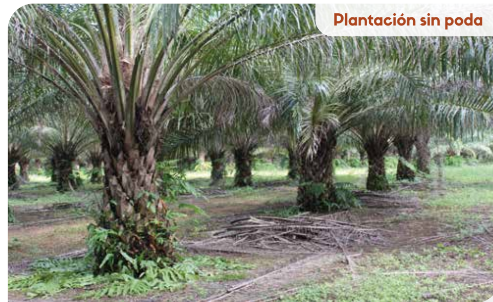
Plantación sin poda

Hace un tiempo, este palmicultor no conocía los daños que ocasionan los barrenadores gigantes de la palma de aceite y desatendió las recomendaciones de mejorar las labores de poda y cosecha.