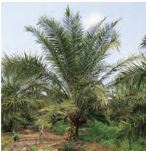
Figura 26. Palma en grado 3.

En estas palmas es más notorio el apiñamiento de las hojas nuevas, las cuales permanecen erectas. En los foliolos de las hojas más viejas ya se observa necrosamiento.