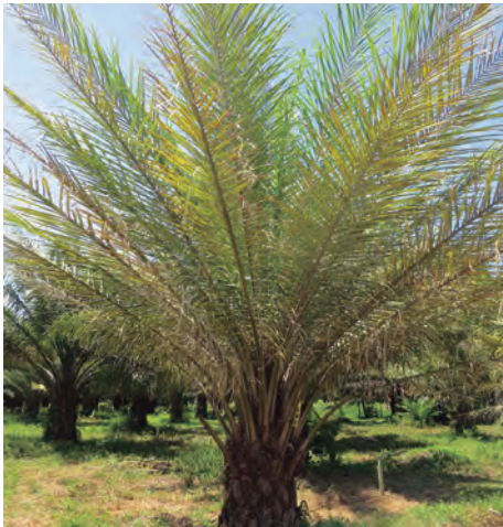
Figura 27. Palma en grado de severidad 4 del Plumero.

En este grado, todas las hojas de la palma presentan los síntomas típicos del Plumero (Figura 27): hojas erectas, clorosis generalizada, disminución del ancho y ángulo de inserción de los folíolos, presencia de rayado blanco longitudinal, banda amarilla, secamiento de folíolos y reducción del tamaño de los racimos.