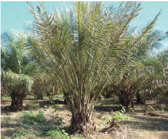
Figura 39. Palma con "choke". Figura 40. Palma con síntomas del Plumero.