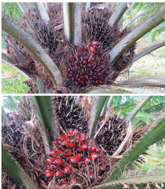
Figuras 19a y 19b. Comparación del estado de los racimos en palma con síntomas iniciales del Plumero (superior) y palma sana (inferior).

En los racimos e inflorescencias de las palmas con síntomas del Plumero no se observan evidencias de deterioro físico (Figuras 19a y 19b). Los racimos alcanzan la madurez tanto en palmas sanas como en aquellas con síntomas del Plumero. El aspecto de los frutos en cuanto a coloración, consistencia, brillo y adherencia al racimo es normal en ambos casos.