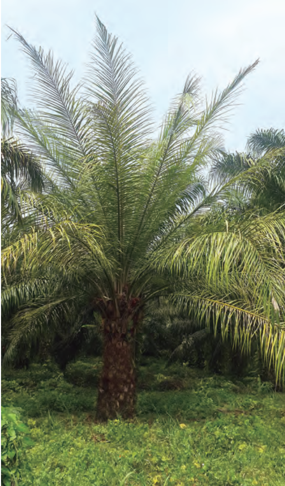
Figura 35. Palma de 10 años; las dos presentan todos los síntomas típicos del Plumero.