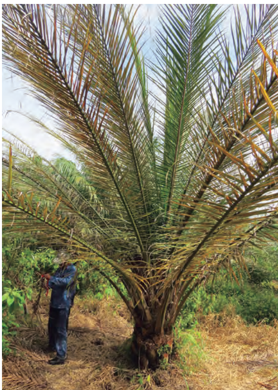
Figura 32. Registro y marcación de palma en campo.

La información que debe ir en la cinta es: línea y número de palma, fecha de registro y hoja en la cual se encontraron los síntomas. Con la marcación se busca evitar la duplicación de registros, facilitar la ubicación y el seguimiento.