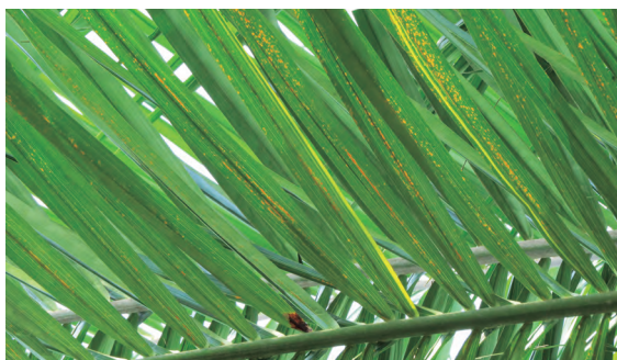
Figura 7. Presencia de dos foliolos con banda amarilla.

Como se observa en la Figura 7, generalmente el síntoma aparece en uno de los dos lados de la nervadura del foliolo y va desde la base hasta la punta. Los foliolos con síntomas aparecen alternos, casi nunca continuos, y de forma indiferente hacia la base como hacia la punta de las hojas.