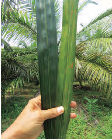
Figura 10. Aspecto clorótico de un foliolo de una palma con el Plumero (derecha) y de una palma sana (izquierda).

El síntoma de foliolos cloróticos aparece siempre en las hojas más jóvenes y se acentúa en la medida en que la severidad del problema aumenta. Si bien este síntoma se ha asociado con deficiencias de azufre, hasta el momento no se ha confirmado dicha asociación. Con el tiempo, la palma adquiere aspecto clorótico en su totalidad.