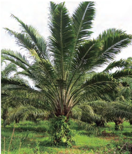
Figura 36. Palma erecta. Anormalidad catalogada como de tipo genético en palma de aceite.