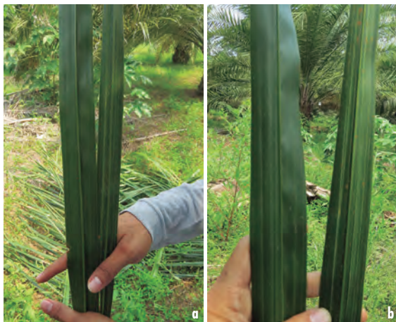
Figuras 11a y 11b. Comparación de la reducción del ancho del foliolo en hoja 9. El foliolo ubicado al lado izquierdo en cada figura corresponde a la palma sana.

La reducción del ancho del foliolo puede ser leve (menor a 30 %) en los estados iniciales de severidad, a fuerte (superior a 80 %), en palmas en grados avanzados y la lámina foliar puede llegar prácticamente a desaparecer.