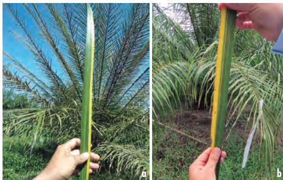
Figuras 6a y 6b. Foliolos con el síntoma conocido como banda amarilla.

Como se observa en la Figura 7, generalmente el síntoma aparece en uno de los dos lados de la nervadura del foliolo y va desde la base hasta la punta. Los foliolos con síntomas aparecen alternos, casi nunca continuos, y de forma indiferente hacia la base como hacia la punta de las hojas.