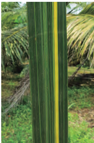
Figura 9. Presencia de la banda amarilla y el rayado blanco longitudinal en un foliolo de palma.

Como se observa en la Figura 9, en algunos casos es posible ver la presencia del rayado blanco longitudinal y la banda amarilla en un mismo foliolo de una palma que presenta los síntomas del Plumero.