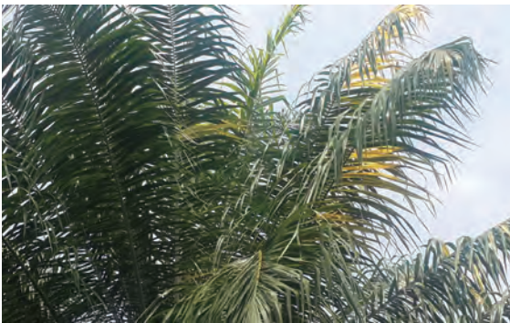
Figura 35. Palma quimera de 10 años de edad.

Estas palmas se han catalogado como una anomalía genética. La principal característica de este tipo de palmas es la presencia de foliolos albinos o amarillentos (Figura 35).