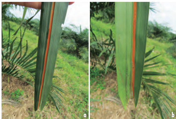
Figura 41a y 41b. Foliolos con presencia de banda naranja.

La banda naranja se presenta a lo largo del foliolo (Figuras 41a y 41b). Se caracteriza por ser de color naranja intenso y al observarla detalladamente se aprecian moteados.