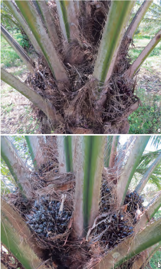
Figuras 22a y 22b. Aspecto de la corona de racimos en palma con síntomas del Plumero (superior) y palma de la misma edad sin síntomas (inferior).