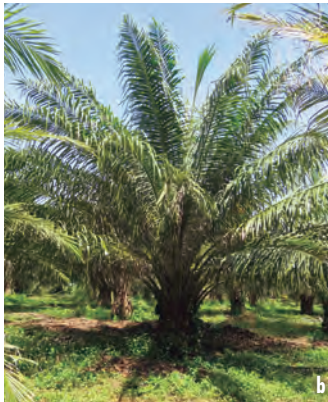
Figuras 17a y 17b. Comparación del área foliar de la palma con el Plumerio (izquierda) y sin Plumerio (derecha).