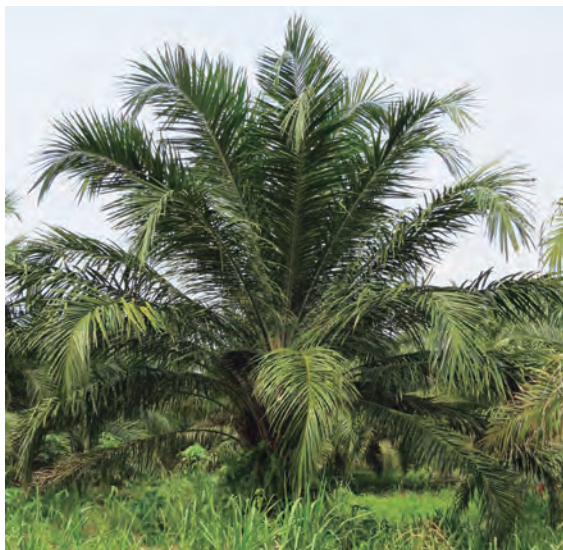
Figura 24. Palma en grado 1 del Plumero.

En el grado 1 no se observan secamientos de los foliolos y la palma luce relativamente normal (Figura 24). Tampoco se aprecia reducción del tamaño de los racimos.