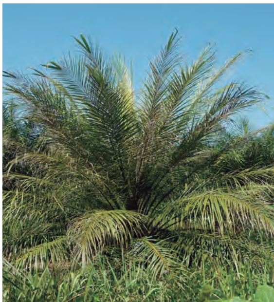
Figura 34. Palma de tres años de siembra.