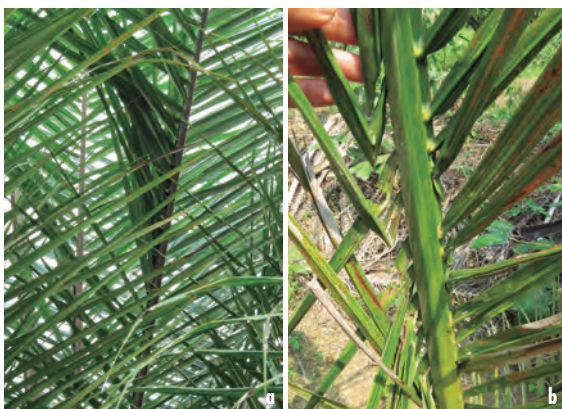
Figuras 28a y 28b. Síntoma de foliolos plegados.

Un síntoma que se ha encontrado en alrededor del 10 % de las palmas afectadas por el Plumero es el que se ha denominado foliolos plegados (Figuras 28a y 28b). Los foliolos de un lado del raquis de la hoja cambian la dirección de inserción. Normalmente el foliolo emerge del raquis hacia la punta de la hoja, pero en el caso de los foliolos plegados, emergen del raquis hacia la base de la hoja.