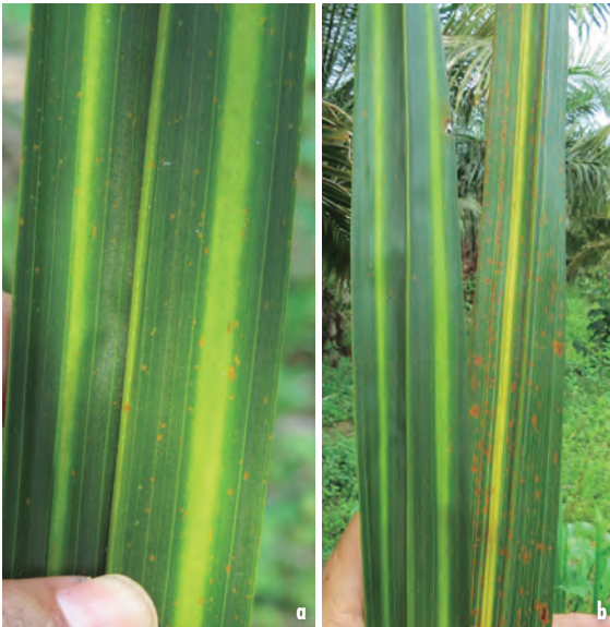
Figura 8a. Banda blanca (desbalance nutricional) y Figura 8b. Comparación entre banda blanca y síntomas de banda amarilla en los folíolos de una palma con el Plumero.

La principal diferencia del síntoma de banda amarilla con el conocido como banda blanca (atribuible a desbalance nutricional entre nitrógeno, potasio y boro) (Figuras 8a y 8b), radica en que la banda amarilla presenta bordes muy definidos, como se dijo previamente, al igual que en el caso de las quimeras o de albinismo, a diferencia de la banda blanca, la cual está formada por una serie de moteados por lo que no tiene bordes definidos (Figura 9).