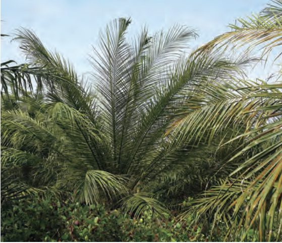
Figura 29. Palma con síntomas de reducción del ancho e inserción aguda de foliolos.

Adicionalmente, en las palmas afectadas por el Plumero, las hojas nuevas permanecen más erectas con respecto a las hojas viejas. Al hacer una vista general del follaje de la palma, se aprecia menor densidad y, por tanto, mayor cantidad de luz.