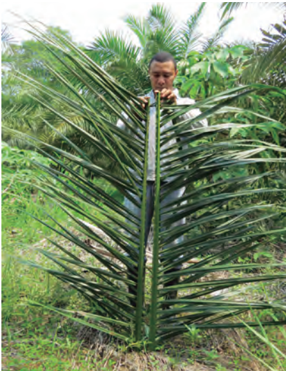
Figura 14. Comparación del ángulo de inserción del foliolo con respecto al raquis de la hoja para una palma con el Plumer (izquierda) y una palma sana (derecha).

Luego de la aparición de los síntomas de rayado blanco y banda amarilla, empieza a presentarse la reducción del ángulo de inserción del foliolo con respecto al raquis de las hojas (Figura 14).