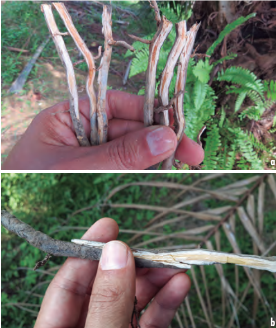
Figura 4a. Comparación de tres raíces de palma con síntomas del Plumero y tres raíces de palma que no presentan síntomas foliares del Plumero. Figura 4b. Detalle de raíz de una palma con el Plumero sin ningún tipo de afectación.

Las raíces de la palma, aun en los estados avanzados de la anomalía, lucen aparentemente sanas (Figuras 4a y 4b), el color es crema o blanquecino, sin presencia de olor fétido. La consistencia es firme y no se observan daños mecánicos.