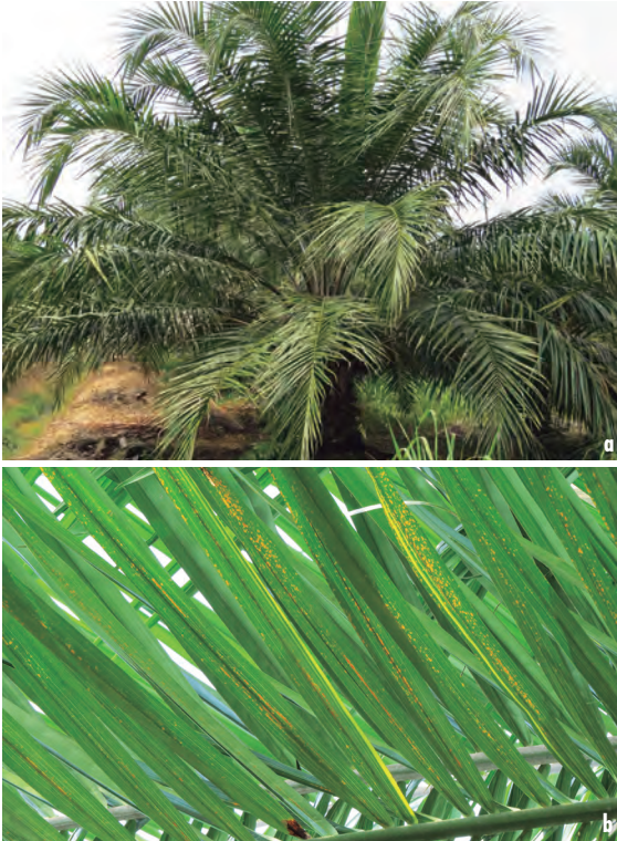
Figura 23a. Palma con presencia de banda amarilla y sin reducción de área foliar. Figura 23b. Detalle.

Estas bandas aparecen en primer lugar en las hojas más jóvenes. Con el paso del tiempo, aproximadamente dos meses después del reconocimiento de los primeros síntomas, las palmas empiezan a mostrar reducción de área foliar.