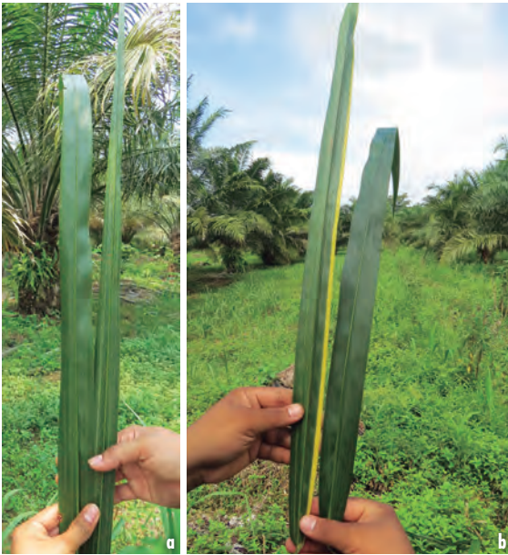
Figuras 13a y 13b. Comparación de foliolos tipo “aguja” en palmas afectadas con el Plumero y foliolos de palmas sanas.

Como se observa en las Figuras 13a y 13b, los foliolos de las palmas con el Plumero tienden a permanecer erectos y no presentan curvatura en la punta, lo cual es común en palmas sanas.