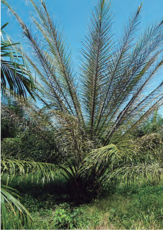
Figura 1. Aspecto general de una palma en estado avanzado del Plumero.

La anomalía conocida como el Plumero se ha presentado en palmas aparentemente sanas, luego de dos años de la siembra en sitio definitivo o del inicio de la producción.