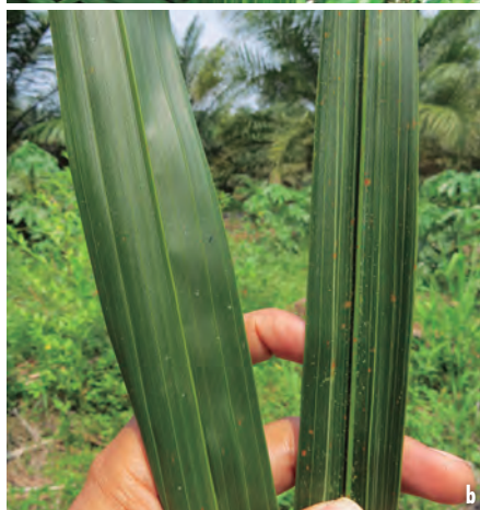
Figuras 5a. Foliolo de palma con el síntoma de rayado blanco longitudinal. Figura 5b. Comparación de foliolo normal con otro afectado.