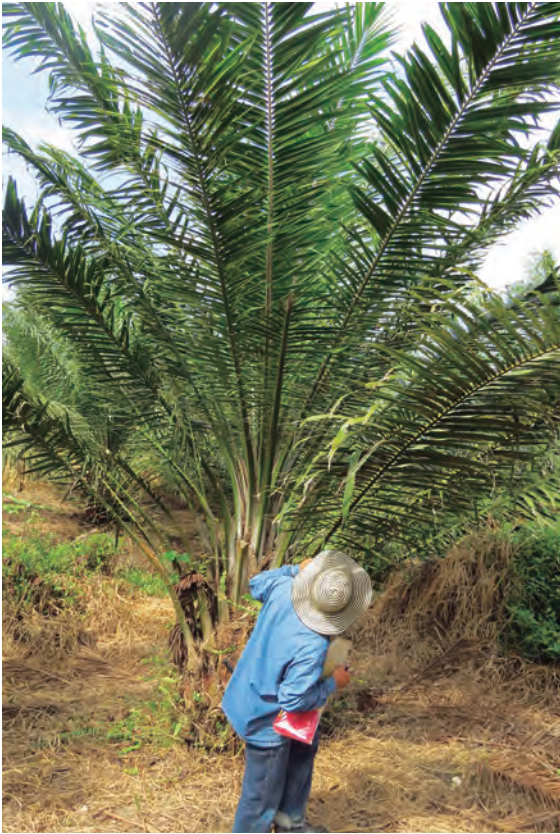
Figura 30. Búsqueda de banda amarilla en palma sospechosa de estar afectada por el Plumero.

afirmar si una palma tiene o no síntomas del Plumero. Para verla, es necesario acercarse a la palma y buscar en el envés de las hojas (Figura 30).