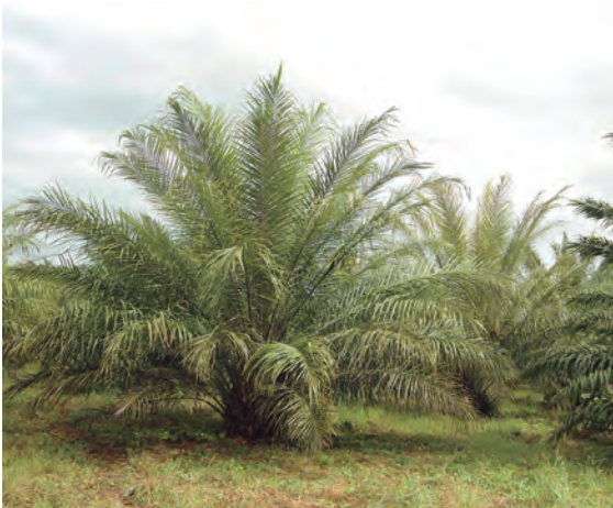
Figura 33. Frecuencia de cercanía de palmas afectadas.

Por otra parte, se recomienda revisar detalladamente las palmas vecinas a las previamente registradas, ya que es frecuente encontrar grupos de palmas afectadas (Figura 33).