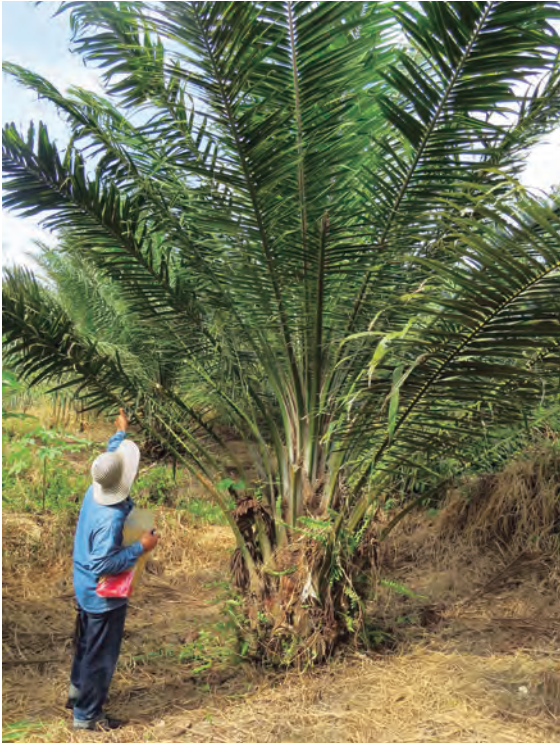
Figura 31. Ubicación de la hoja para registro de palmas afectadas por el Plumero.