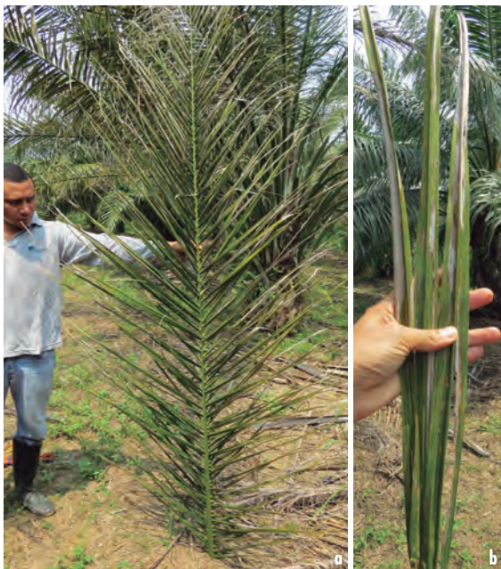
Figuras 15a y 15b. Aspecto de hoja en estados de severidad avanzados.