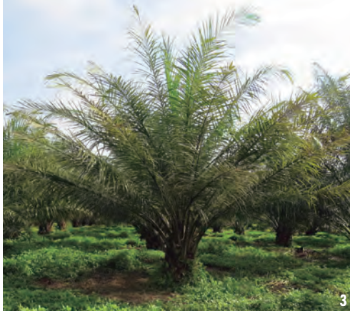
Figuras 2 y 3. Palmas de 2 y 4 años de siembra con síntomas del Plumerio.