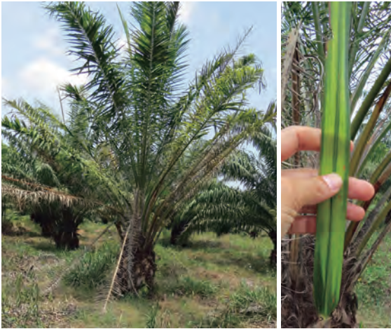
Figuras 37 y 38. Palmas con desbalance nutricional asociado con la genética.

Este tipo de palmas se caracteriza por la aparición del síntoma típico de banda blanca (Figuras 37 y 38).