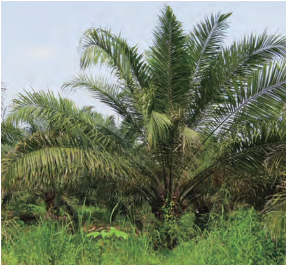
Figura 25. Palma en grado de severidad 2.

En este tipo de palmas ya se observa el apiñamiento de las hojas nuevas y la palma dividida en dos estratos: uno con hojas erectas y apiñadas, y otro con hojas normales y extendidas (Figura 25). En la punta de los folíolos afectados se observan síntomas de necrosamiento. Aún no se observan cambios en la producción y/o tamaño de los racimos.