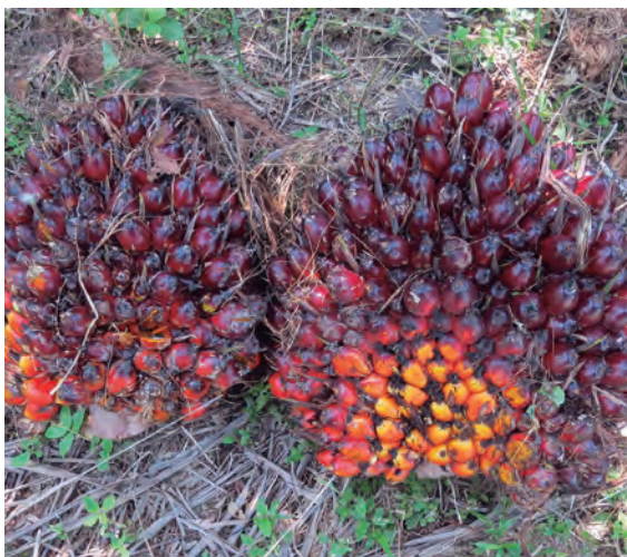
Figura 21. Comparación del tamaño del racimo de una palma con síntomas del Plumero (izquierda) y palma sana (derecha). Racimos de palma de cinco años de siembra.

La baja producción se debe a la reducción del número de racimos, que incluso puede llegar a cero, como se observa en la fotografía, y a la reducción del peso de los mismos (Figura 21).