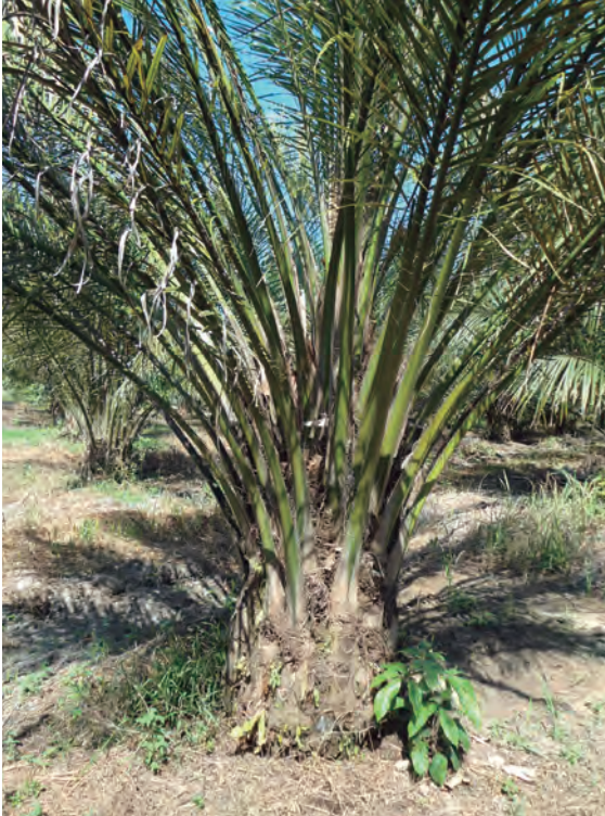
Figura 20. Palma con el Plumero en estado avanzado y baja producción.

Respecto al comportamiento de la producción, palmas con alto grado de severidad reducen la producción drásticamente (Figura 20). Datos reportados por las plantaciones afectadas han mostrado que la producción en lotes con incidencia superior al 30 %, puede reducirse hasta en 50 %.