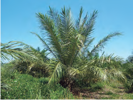
Figura 16. Aspecto general de hojas erectas en palmas afectadas por el Plumerio.

Igual que los síntomas anteriormente mencionados, las hojas nuevas son las primeras que se deterioran y se origina un efecto acumulativo. Además, el final de la hoja, que en palmas normales se dobla, en las palmas afectadas por el Plumerio, permanece erecto, hecho que facilita la identificación en campo ya que sobresalen por encima de las palmas normales. Lo anterior es especialmente aplicable en palmas jóvenes.